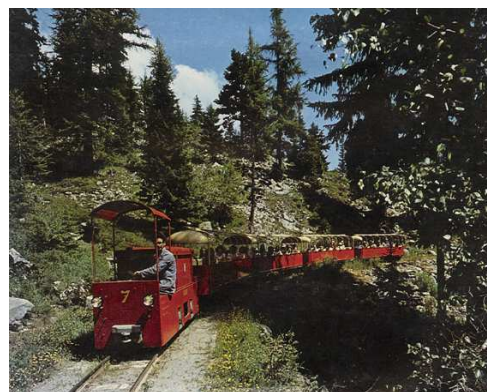
Маленький Панорамный Поезд Шатляра (1975 г.)

Для спасения старого Фуникулера в 1975 г. был построен Маленький Панорамный Поезд . Он начал возить пассажиров по избежавшему затопления старому рельсовому пути длиной в 1850 метров, ведущему на плато Емоссон. Туристы ездят по склону холма до подножия плотины Емоссон, в 12-14 местных вагонах для обозрения, из окон которых можно наблюдать грандиозный хребет Мон-Блана, как с собственного балкона. По 60ти сантиметровой колее типа Довиль (Deauville), поезда обычно передвигаются при помощи тягачей с электроаккумуляторами (которые подзаряжают каждую ночь). Некоторые специальные поезда используют паровозы или дизельные локомотивы. Одноколейная ветка имеет два промежуточных двухколейных участка, что позволяет поездам при необходимости ходить с интервалом в несколько минут. Маленький Панорамный Поезд, который часто называют "Пропасть-экспресс", приступил к работе 12 июля 1975 года.