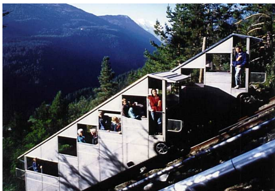
Исторический фуникулёр Шатляра (1920 г.)

Парк Аттракционов Шатляра (Parc d'Attractions du Châtelard VS SA) был основан в январе 1975 г.,